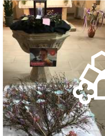
Die Lätaresträuße für den Gottesdienst in Aschbach hat die Mesnerin Christa Keck gebunden.

Ein Lätarestrauß wird immer für andere gemacht, man muss ihn weitergeben. Die Freude wird einem anderen Menschen mitgeteilt. Wie die Hoffnung und die Freude weitergegeben werden müssen, so soll auch der Lätarestrauß ein Zeichen der weitergegebenen Hoffnung und der vorösterlichen Freude sein: Die darf sich ausbreiten und vermehren – ganz unkontrolliert.