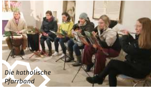
Die katholische Pfarrband