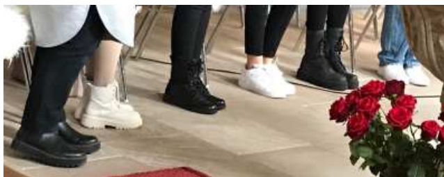
Die Schuhe der Konfirmanden.

wir uns Gott öffnen und ihn um Vergebung bitten, erfahren wir wieder eine Leichtigkeit in unserem Leben. Dies taten die Konfirmanden mit dem Beichtgebet und erhielten das erste Abendmahl.