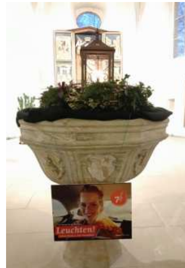
Der erleuchtete Chorraum mit Taufstein in der Kirche St. Laurentius in Aschbach

Christiane Bachmayer für das Vorbereitungsteam