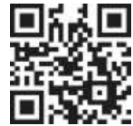
QR-Code zum YouTube-Video

Übrigens bleiben unsere Kirchen in Corona-Zeiten länger geöffnet: In Aschbach täglich 10–18 Uhr, in Hohn sonntags 10–18 Uhr oder auf Anfrage. Treten Sie ein, kommen Sie zur Ruhe, sprechen Sie ein Gebet und tanken Sie Kraft.