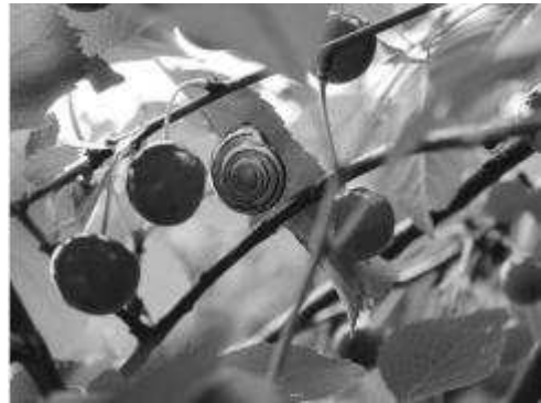
»Anders sein«

• Di., 13. Juni 2017, 17:30 Uhr: Vortrag des Krisendienstes Mittelfranken: „Krisen können jeden treffen“