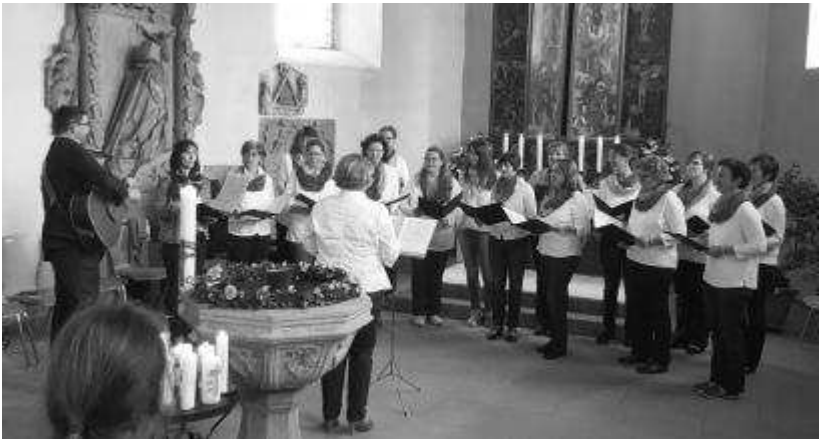
Die Dankandacht am Nachmittag gestaltete der Gospelchor "Song of Joy" aus Abtswind musikalisch aus.

In einem festlichen Gottesdienst in St. Laurentius feierten elf junge Christinnen und Christen aus unserer Gemeinde das Fest ihrer Konfirmation in St. Laurentius. Wir wünschen Ihnen Gottes reichen Segen auf ihrem Lebensweg!