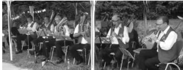
Die Blaskapelle Aschbach